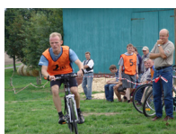
Fahrradfahren und Schießen, eine anspruchsvolle Kombination

Mitmachen kann jeder. Jugendliche, Damen, Herren und Senioren. Auch Firmen sind gerne willkommen. Eine Mannschaft, bestehend aus drei Teilnehmerinnen bzw. Teilnehmern.