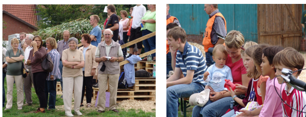
Alt und Jung – alle machen mit und haben Spaß

An beiden Tagen ist für das leibliche Wohl gesorgt. Kaffee und traumhafter Schlemmerkuchen, gebacken von Grauer Kuchenkünstlerinnen, verwöhnen das Publikum. Die Thekenmannschaft versorgt euch mit Energie-Drinks und der Wurstwagen sorgt für etwas deftigere Geschmacksausprägungen.