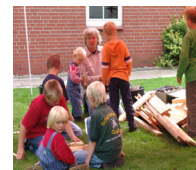
Auch die „Kleinen“ haben viel Spaß beim Biathlon

Je Schießeinlage werden 5 Schuss mit dem Luftgewehr auf die 10 Meter entfernten mechanischen Klappscheiben abgegeben. Die Trefferfläche dieser Scheiben hat für den Liegend- und Stehendanschlag einen Durchmesser von 35 mm. Im Gegensatz zum Winterbiathlon werden die Gewehre während des Fahrradfahrens nicht auf dem Rücken getragen, sondern verbleiben in Gewehrständen vor den Schießbahnen. Die Gesamtstrecke für das Fahrradfahren variiert je nach Altersklasse. Für jede nicht getroffene Scheibe muss eine Strafrunde mit dem Fahrrad gefahren werden.