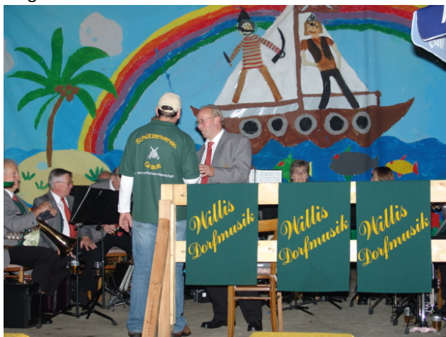
Willi's Dorfmusik – ein Garant für gute Laune

Wir starten am Sonntag, den 31. August 2008, um 11:00 Uhr zum Frühschoppen auf dem Hof Dierks in Graue. Musikalische Unterstützung erhalten wir von Willi's Dorfmusik , die wie immer für exzellente Unterhaltung sorgen wird.